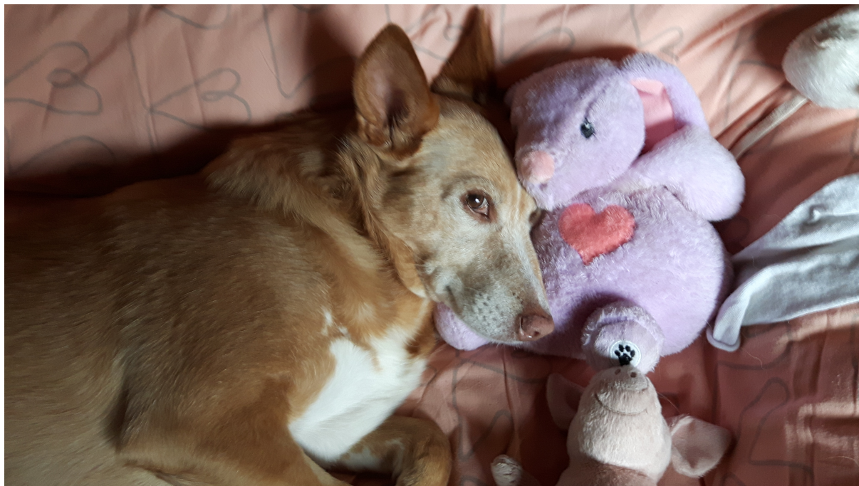
JOLITITA ME REGARDE 2022